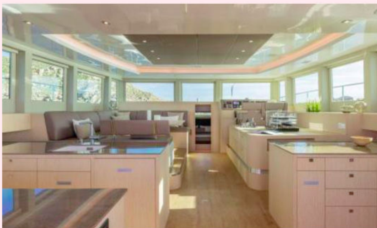
L'interno è molto luminoso, con un layout molto lineare

potenti pannelli solari che raggiungono fino a 16 kWp di picco e sono posti sul tetto del ponte centrale. Alimentano una batteria con capacità sino a 210 kWh che a sua volta muove due motori elettrici da 250 kW l'uno. Il sistema, secondo il cantiere, rende possibile la navigazione a emissioni zero sino a 100 miglia nautiche al giorno, per settimane intere. Il segreto - non è tale, peraltro - è che la disposizione dei componenti consente allo yacht di alimentare tutti i sistemi di bordo senza la necessità di azionare un generatore. Questo viene utilizzato solo per ricaricare le batterie nei rari casi in cui è necessario sostenere velocità più elevate per periodi di tempo più lunghi o quando le condizioni meteorologiche sono sfavorevoli per diversi giorni. Un piccolo gioiello tecnologico il cui costo supera i due milioni di euro. Che ha preso il mare a Fano.