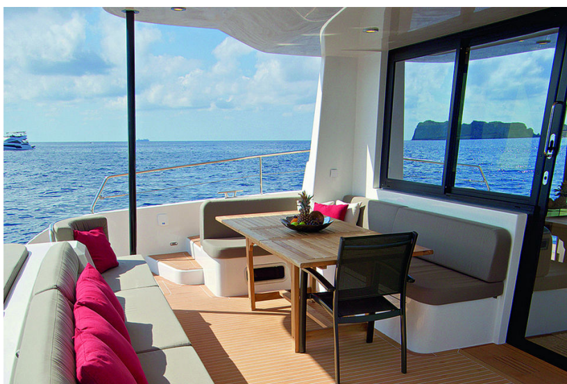
Преимущество любого катамарана – простор на борту

Катамаран-бестселлер Silent 55 несет «чешую» из 30 солнечных панелей последнего поколения. Они встроены в крышу, чтобы принимать на себя «солнечные удары». Каждая на 10 кВт-пик. Это наибольшая мощность энергии, которую реально накопить в идеальных погодных условиях. Они максимально открыты солнцу, поэтому у яхты очень компактный флайбридж – верхняя палуба с парой лежаков, диваном и внешним постом управления.