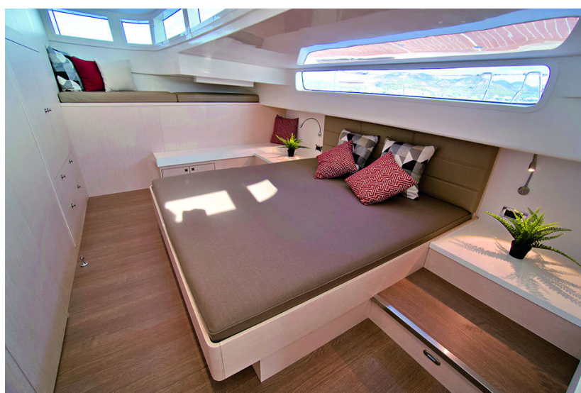
Мастер-каюта в основной части яхты

С минувшего лета верфь больше не предлагает модель длиной 19,5 м (Silent 64). На замену ей в линейке пришли сразу три катамарана. Silent 64 уходит в историю, но остается знаковой для компании. В феврале прошлого года такая лодка за 16 дней преодолела Атлантику! Вышла из Картахены и пришвартовалась на Барбадосе две недели спустя. Прорывной проект заставил еще крепче поверить в будущее альтернативных технологий. За переход команду Silent-Yachts наградили престижной премией Ocean Award, учрежденной авторитетным британским яхтенным журналом.