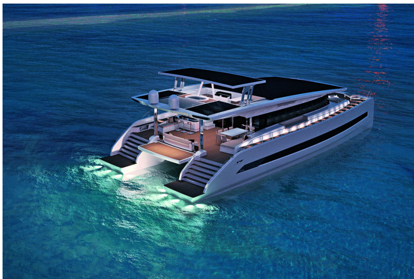
Длина Silent 80 – 24 метра