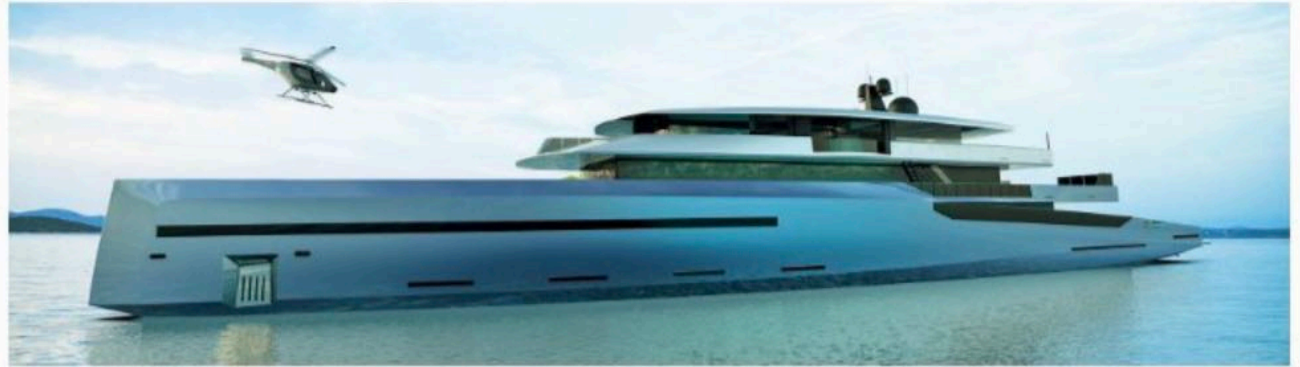
Superschnitte mit Heliport.

SUPERYACHT-KONZEPT. Die in Barcelona und Palma de Mallorca ansässige BRAVO YACHT DESIGN GROUP hat erste Bilder ihres Superyacht-Designkonzepts Bravo 75 vorgestellt. Neben den üblichen Luxuszutaten (Heliport, Whirlpool, große Garage für Tender & Co., vollständig verglaste Flybridge, die komplett geöffnet oder geschlossen werden kann, etc.) haben sich die Spanier vor allem Gedanken um den Antrieb gemacht. Herausgekommen ist eine Dreifach-