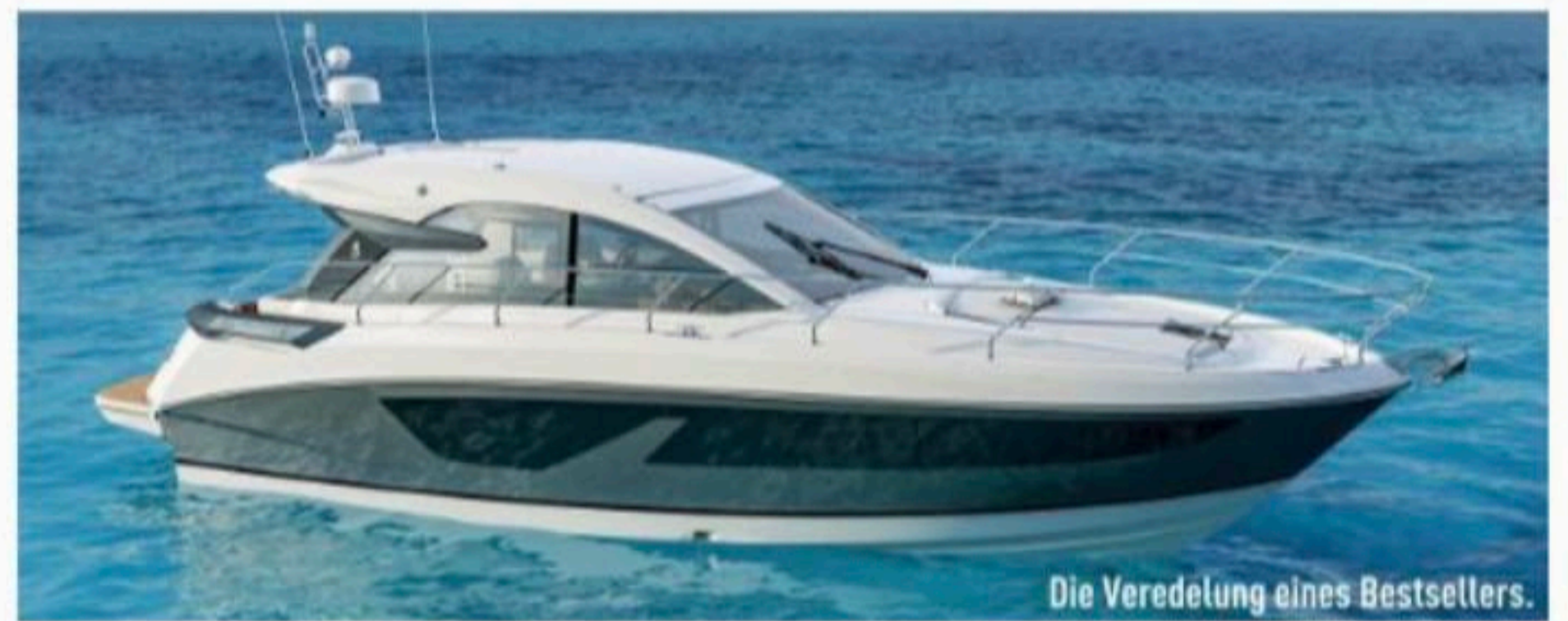
Die Veredelung eines Bestsellers.